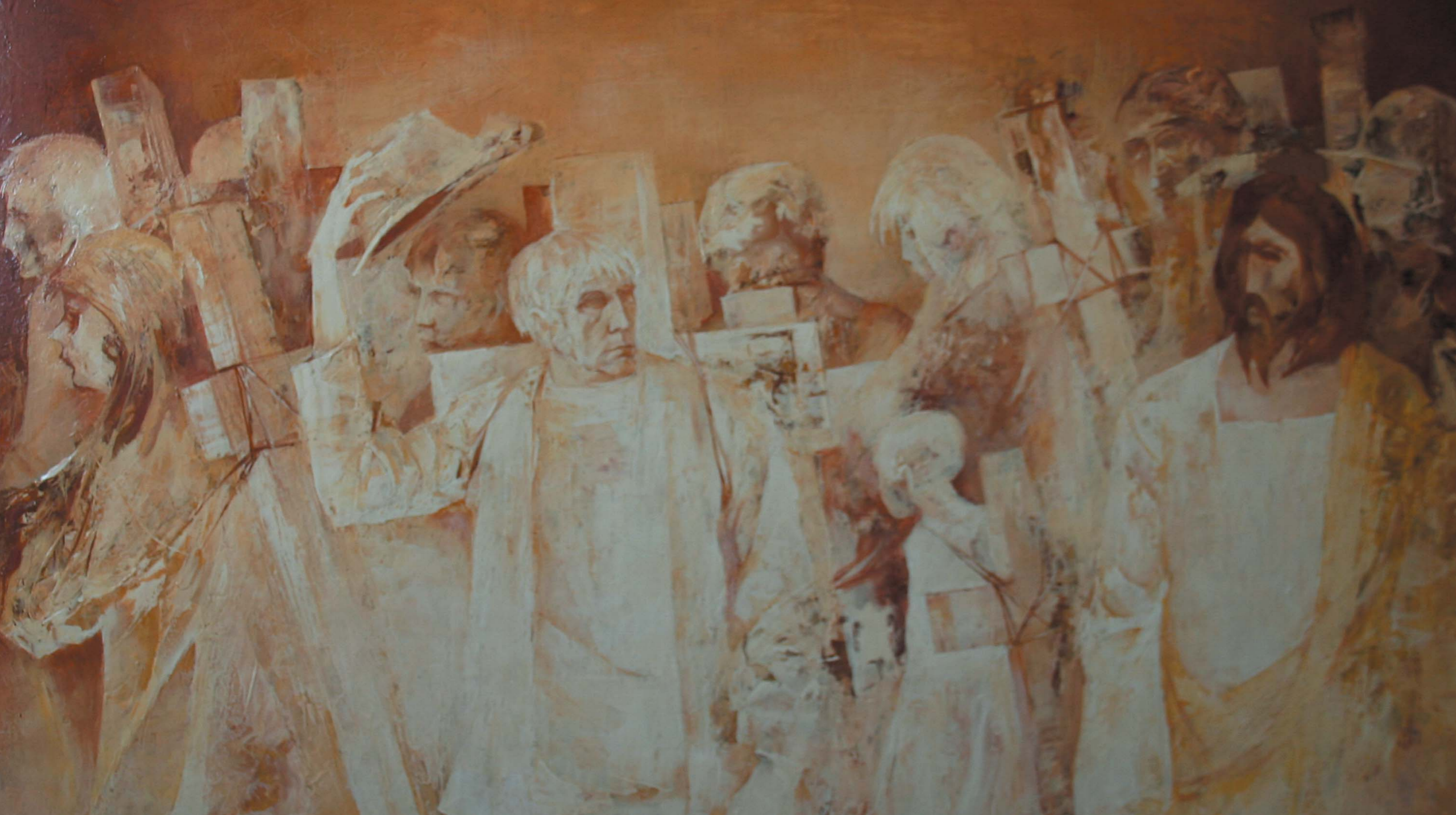
Krisztus Pesten 1987, olaj-farost, 100x120 cm, j. b. I