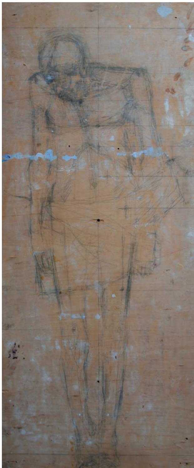
Vázlat (Önarckép) 1999-2003, szén, farost, 50x120 cm