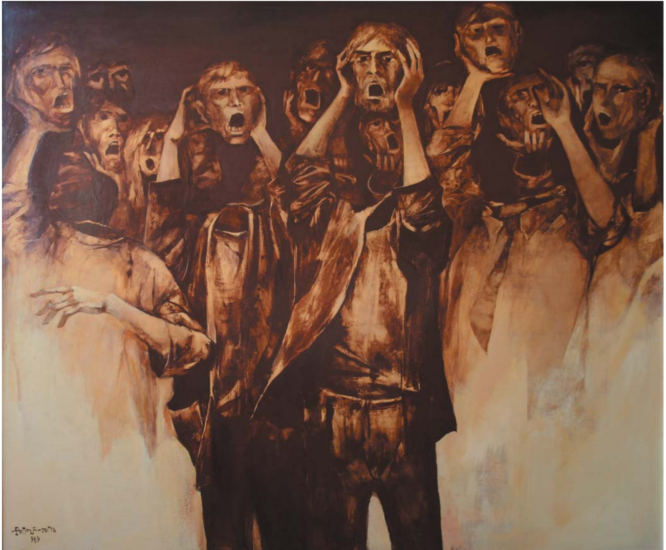
Az ötödik rend 1989, olaj-farost, 100x120 cm, j. b. I

„Somogyi Soma László a legérzékenyebb kedélyű és árnyaltan érvelő tehetségek közé tartozik, olyan valaki, akit nem hagy közömbösen az írott szó, a szokatlan esemény... Minden jelenségben, az emberi elme valahány megnyilatkozásában megtalálja a változások megm. ásíthatatlan mozgástörvényeit... Törékeny bolygója azt sejteti, hogy a felhalmozott társadalmi feszültségek robbanással fenyegetik glóbuszunkat... A művész kálváriák útját járja, a festőállvány az ő keresztje...”