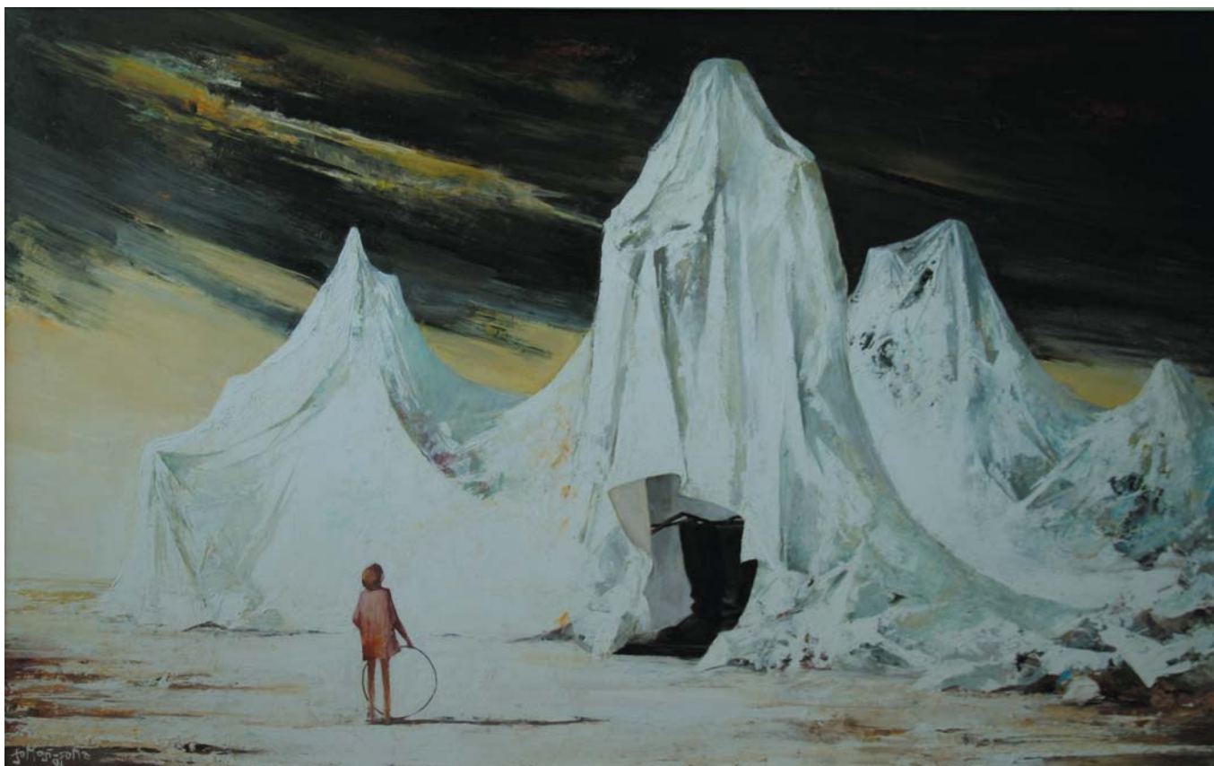
Quidquid latet 1996, olaj-farost, 80x125 cm, j. b. I