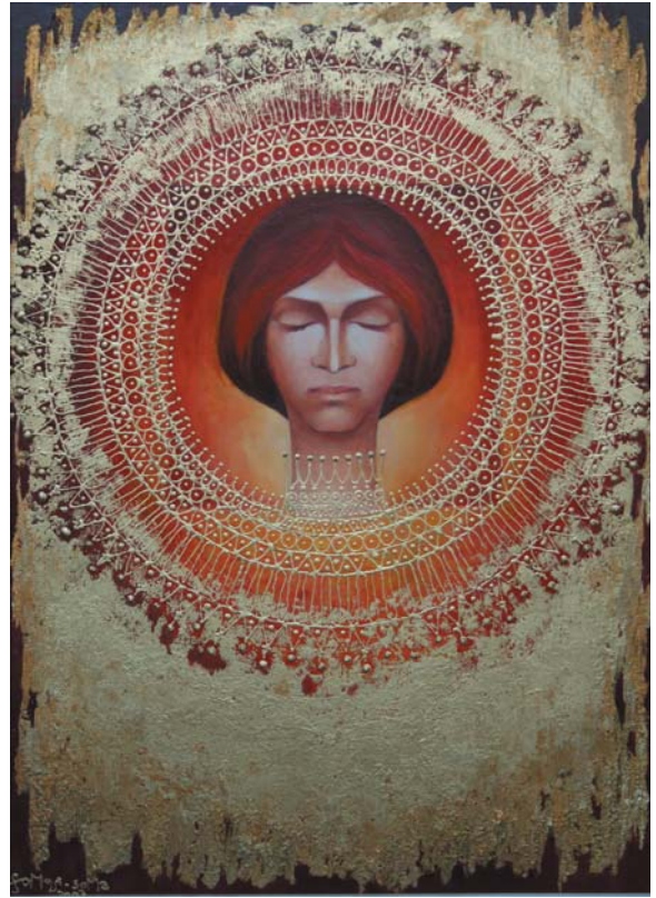
Aranylány 2003, olaj-farost, Á: 40 cm, j. b. I