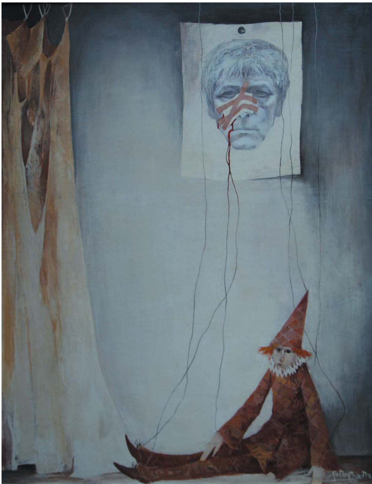
Egy arcműtét emlékére 1988, olaj-farost, 90x70 cm, j. j. I