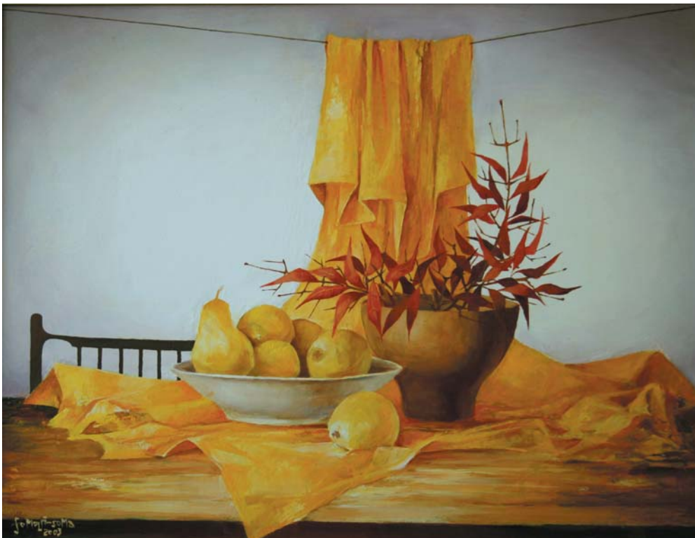
Sárgadrapériás csendélet (utolsó csendélet) 2003, olaj-farost 60x80 cm, j. b. I