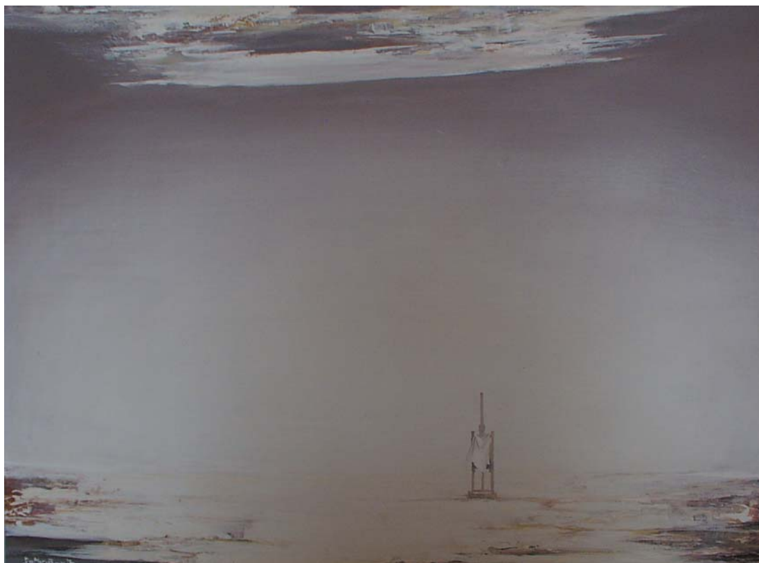
Cantata Humana (a negyedik) 1984, olaj-farost, 80x60 cm, j. b. I