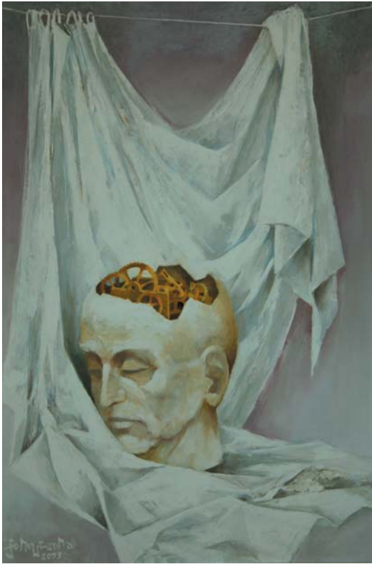
I. Q. 2003, olaj-farost, 60x40 cm, j. b. I