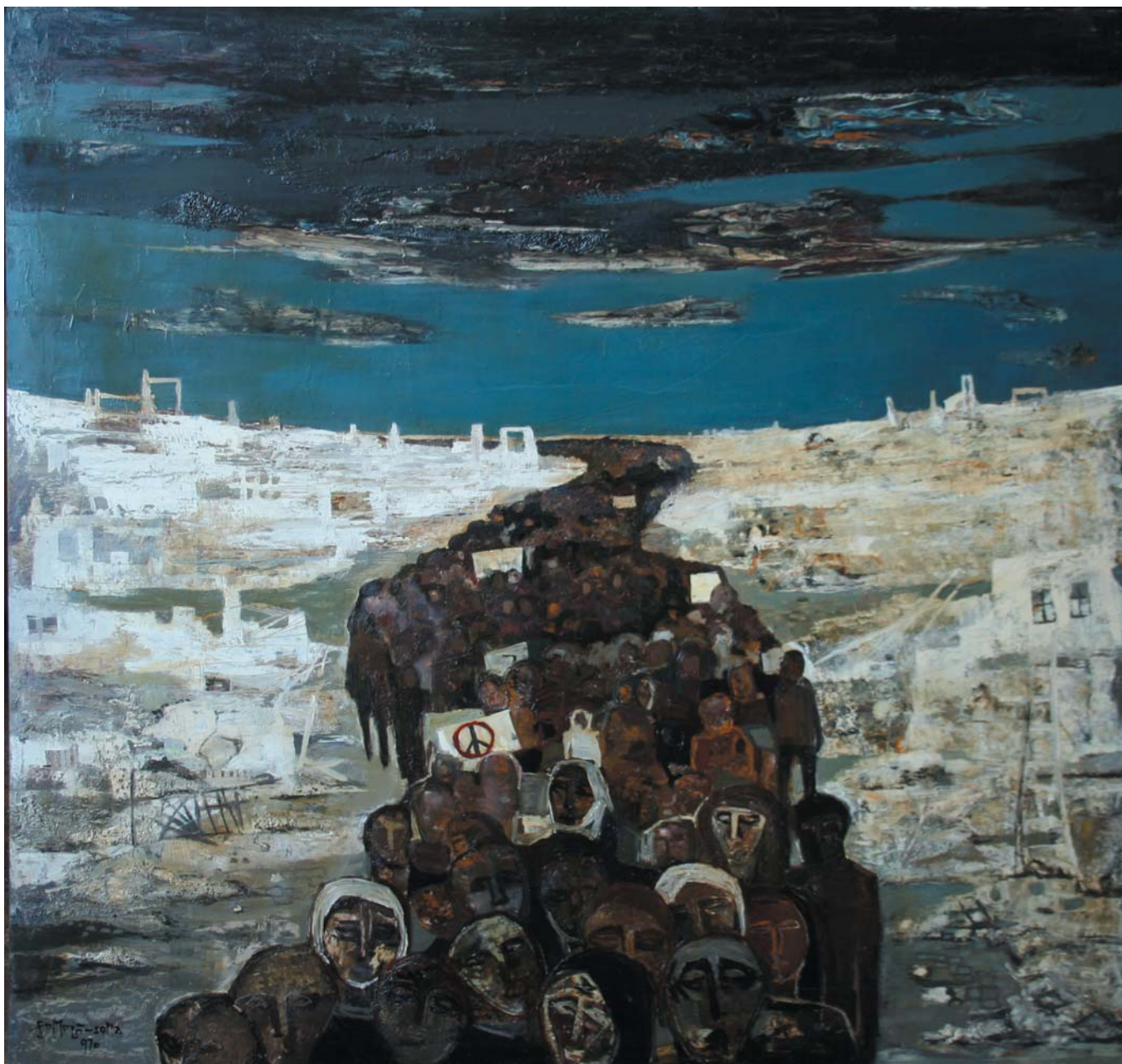
Békemenet (Túlélők) 1970 olaj-farost, 115x123 cm, j. b. I

„... ecsetjét elsődlegesen a mindig valamilyen módon vesztes, a mindig jelenlévő áldozat drámája vezérli. A kép-gondolat kihordásakor egyé válik képével, saját, kéreg alá fúródott sérelmeivel, érdemtelenül kapott sebeivel táplálva művét. Egy-egy katartikus súlyú teremtés után a festő fantáziája különös tájakon pihen. Örömmel időz alkotó képzelete kedvenc tárgyainál is. Egy ingaóra részleteinél, nyitott könyv lapjánál, kedves kerámiáinál. Megragadja a fehér csipke mívessége, körül lehelve vele ikon Madonnáját...”