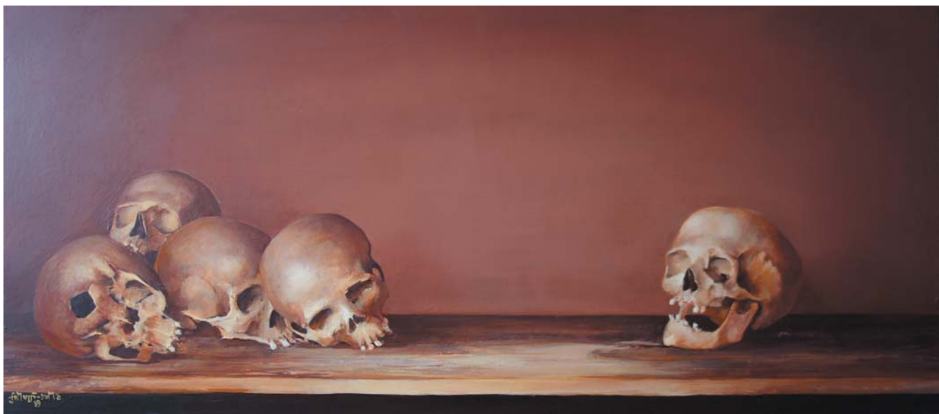
A jó fej 1983-85 olaj-farost, 55x125 cm, j. b. I