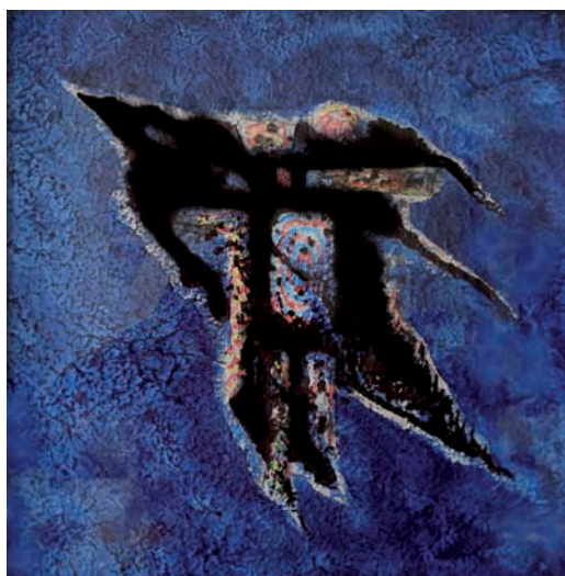
Emlék (tus, öntött papír) 50 x 50 cm, 2008.

http://www.fesztivalirodagyor.hu/mgy/koppany_attila.htm ill. www.art-koppany.sze.hu