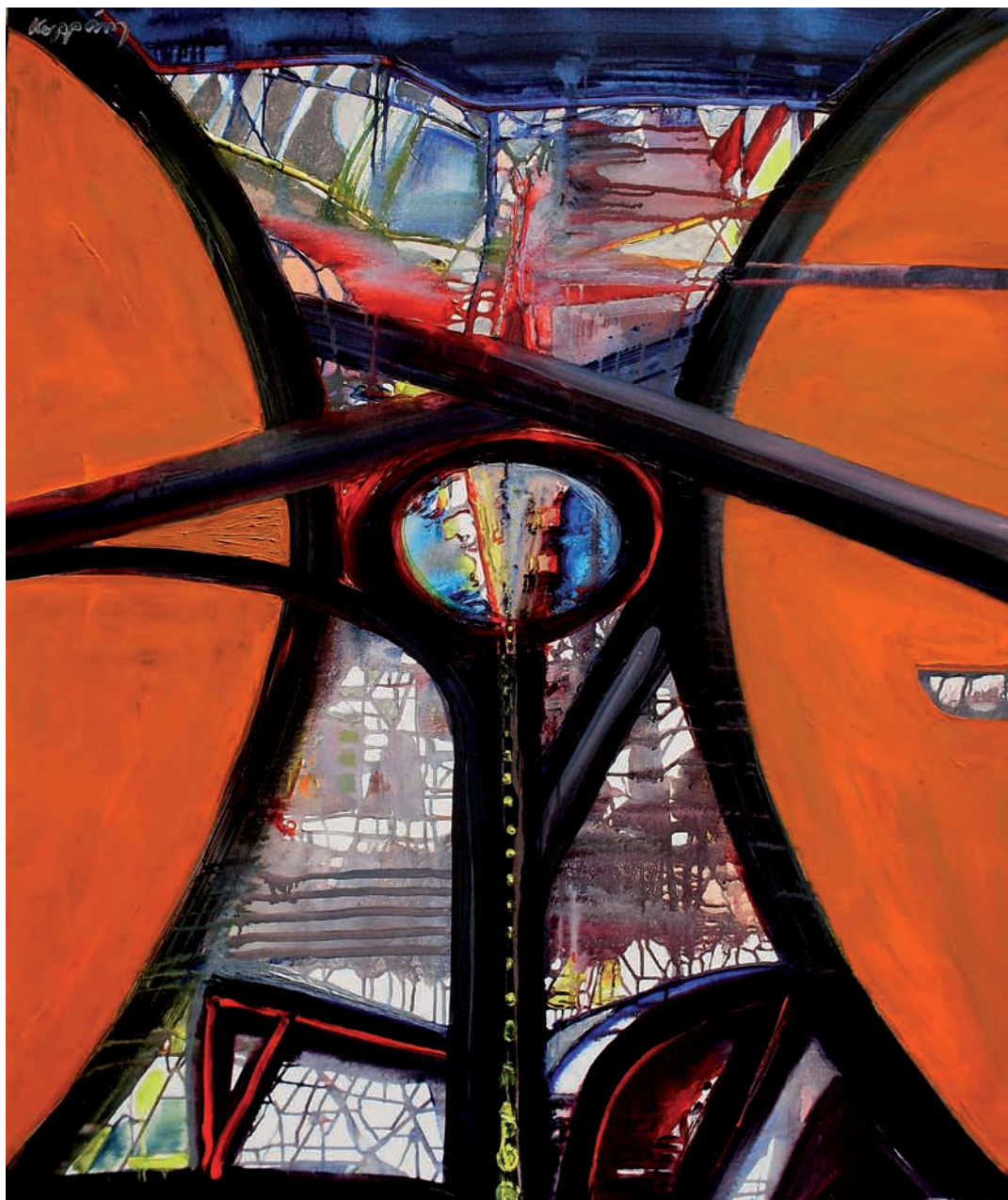
Homokóra (akril, vászon) 120 x 100 cm, 2008.

A borítón: Hommage à El Kazovszkij (akril, vászon) 40 x 30 cm 2008.