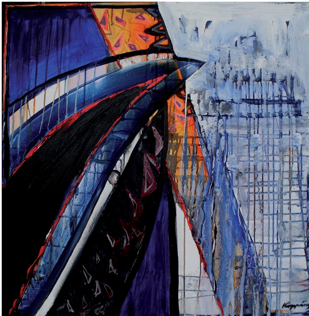
Változás (akril, vászon) 80 x 80 cm, 2008.

Koppány Attila festőművész (Enying 1947. február 25.) diákéveit Székesfehérvárott töltötte. Képzőművészeti körökben és szabadiskolákban ismerkedett meg a festészet és a grafika technikáival és az alkotás alapvető folyamataival. Székesfehérvárott Áron Nagy Lajos és Ballagó Imre festőművészek tanítványa volt, ebben az időszakban két alkalommal díjazták aranyéremmel munkáit (1963, 1965) a Keszthelyi Helikoni Ünnepeken.