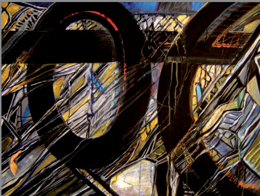
Wind of Change (akril, vászon) 50 x 80 cm, 2007.