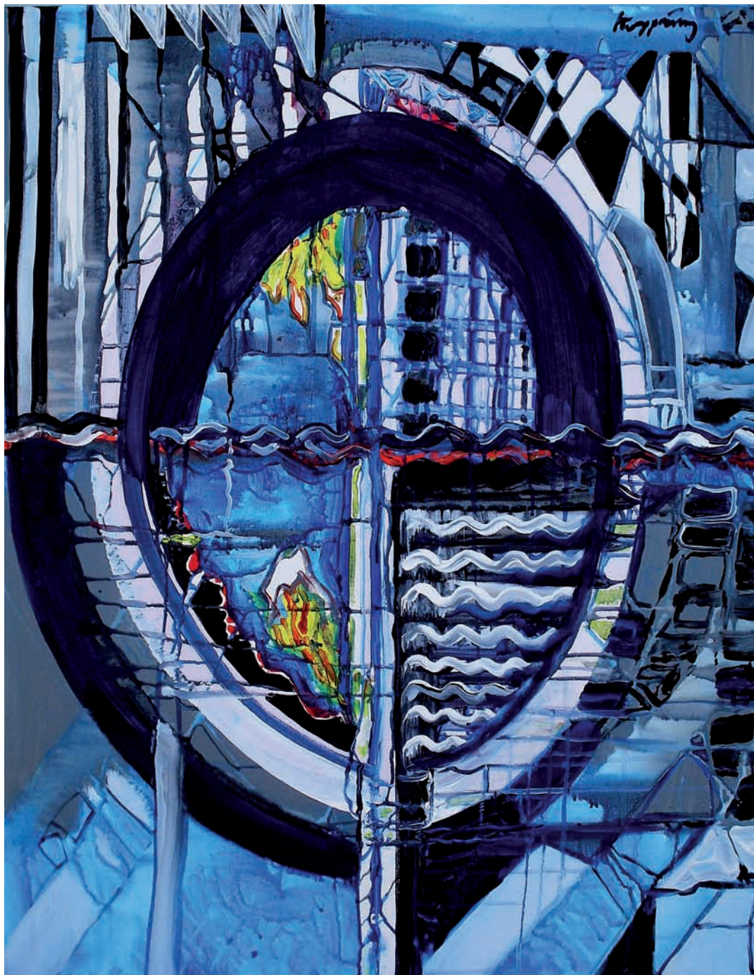
Űr-objektum (akril, vászon) 90 x 70 cm, 2008.