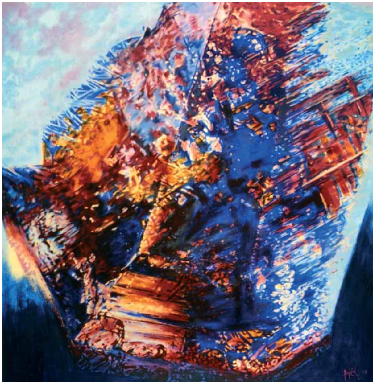
Gradáció acryl, vászon, 150 x 150 cm, 2007