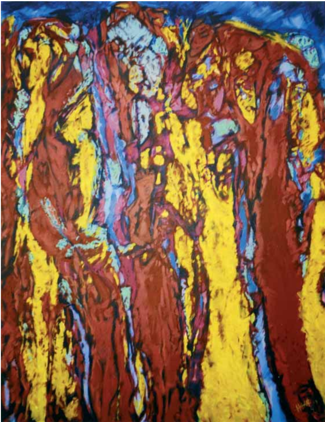
Darwin álma acryl, vászon, 150 x 120 cm, 2007