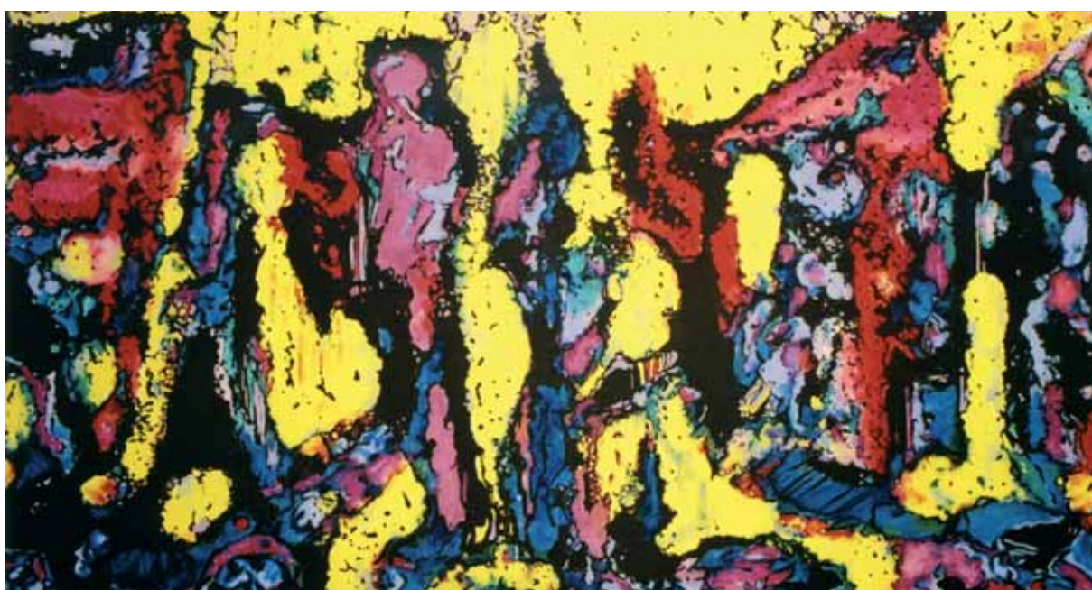
Az urak tánca acryl, vászon, 100 x 200 cm, 2007