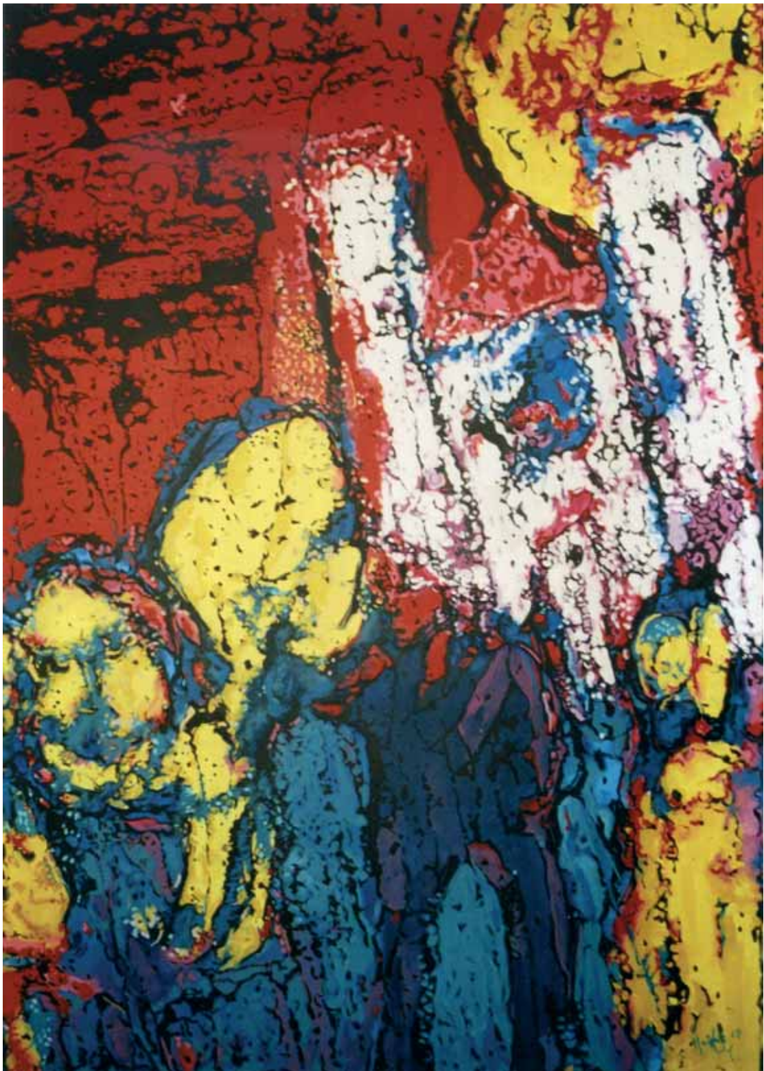
Karma acryl, vászon, 165 x 119 cm, 2007